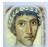
La Commissione Scientifica

Un sincero ringraziamento per la cortese attenzione e un cordiale saluto.